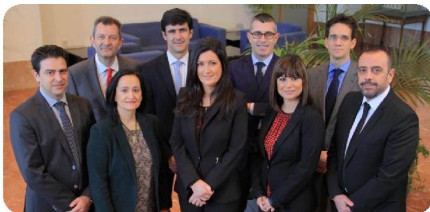
Órgano Ejecutivo valora prevención

Para conseguirlo, sabemos que son imprescindibles: la implicación y compromiso que consigamos de nuestro equipo humano , los vínculos estables que seamos capaces de crear con nuestros proveedores , nuestra contribución a la mejora de la sociedad a la que pertenecemos y, finalmente, a resultados de todo ello, que logremos obtener unos resultados económicos positivos .